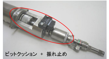
ビットクッション + 振れ止め